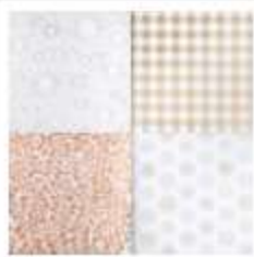
Year Of Cheer Specialty Designer Series Paper [144640]