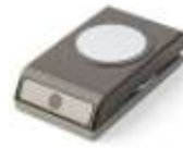
Starburst Punch [143717]