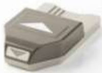
Banner Triple Punch [138292]