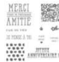
Lèche-Vitrine Clear-Mount Stamp Set [143407]