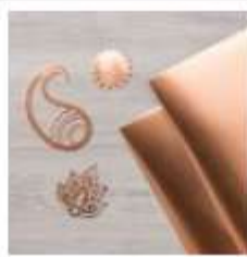
Copper Foil Sheets [142020]